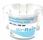
3. 7076 Ralentisseur à l'entrée