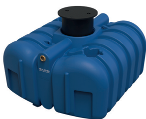
1. 7350 easy rain 5000 cuve eau de pluie 5000l plat