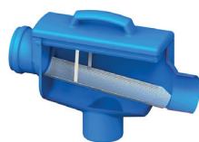
2. 6817 Filtre eau de pluie Slim rain it