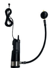
5. 9040 + 7088 Pompes immergees automatiques divertron 900 x avec filtre d'aspiration et tuyau d'aspiration 0.75m